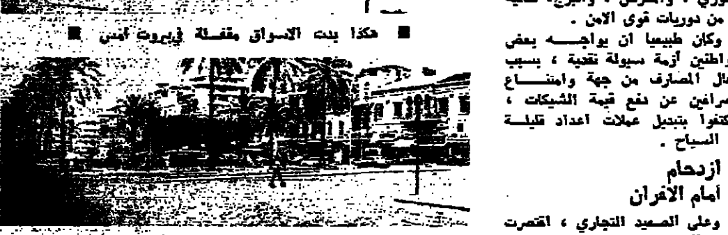
مكدا بيت الاسواق مقفلة في بيروت أمس

اقتت المصارف أمس في بيروت منذ ساعات الصباح الأولى، وأسبغ اغلاق المؤسسات التجارية والمصارف، وكثرت حركة السير بطيئة جدا، وانتصر التجول على شراء المسواد الغذائية التي سجلت ارتفاعا كبيرا في أسعارها. وكان ذوي الإحتياجات والإصوات العينية وأصداه الطلقات التلويكافية لاغداد الشوارع، وبيت منطقة بشارة الخوري، والحرض، والبرج، خالية إلا من دوريات قوى الأمن. وكان طبيعا أن يواجه بعض المواطنين أزمة سهولة تقنية، بسبب اقبال المصارف من جهة وامتناع المصارف عن دفع قيمة الشيكات، وانقروا بتبديل عملة اعداد قليلة من المساح.